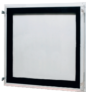
skúšané do rozmeru 600 x 600 mm

Teraz tiež vo verzii " vzducho a prachotesné " a tiež v antikorovom vyhotovení.